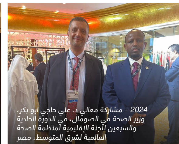
2024 - مشاركة معالي د. علي حاجي أبو بكر، وزير الصحة في الصومال، في الدورة الحادية والسبعين للجنة الإقليمية لمنظمة الصحة العالمية لشرق المتوسط، مصر